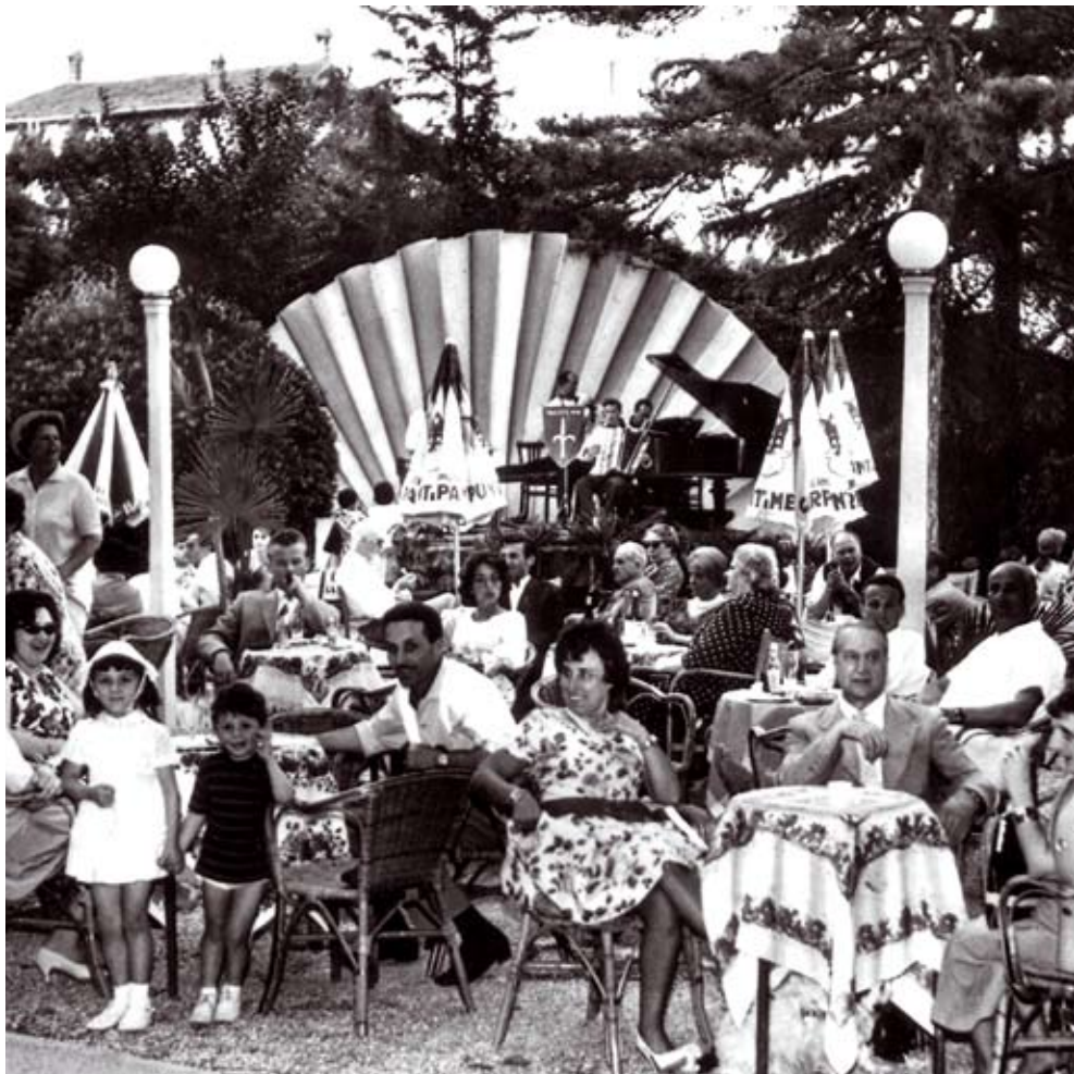
Concertino al Parco della Salute - Grado

SABATO 7 AGOSTO - ORE 21.00 Grado - Diga Nazario Sauro